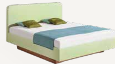
CLIA_1 AUSFÜHRUNG D

Der klassische Polsterbettrahmen besteht aus einem massiven Holzrahmen, gepolstert mit Schafschurwolle. Anschließend wird dieser mit dem Basisbezug in der Stoffart und Farbe Ihrer Wahl bezogen. Dieser Bezug ist nicht abnehmbar. Die variable Absenkung ( 9 | 13 | 16 | 19cm) der Unterfederung lässt nahezu alle Unterfederungen zu und Sie bestimmen Ihre bevorzugte Liegehöhe. Mit der Festlegung, ob die Rückenlehne rahmenbündig oder bodenbündig angebracht wird, lässt sich die Optik Ihres Posterbettes zusätzlich bestimmen.