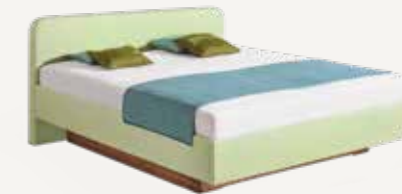
CLIA_1 AUSFÜHRUNG B